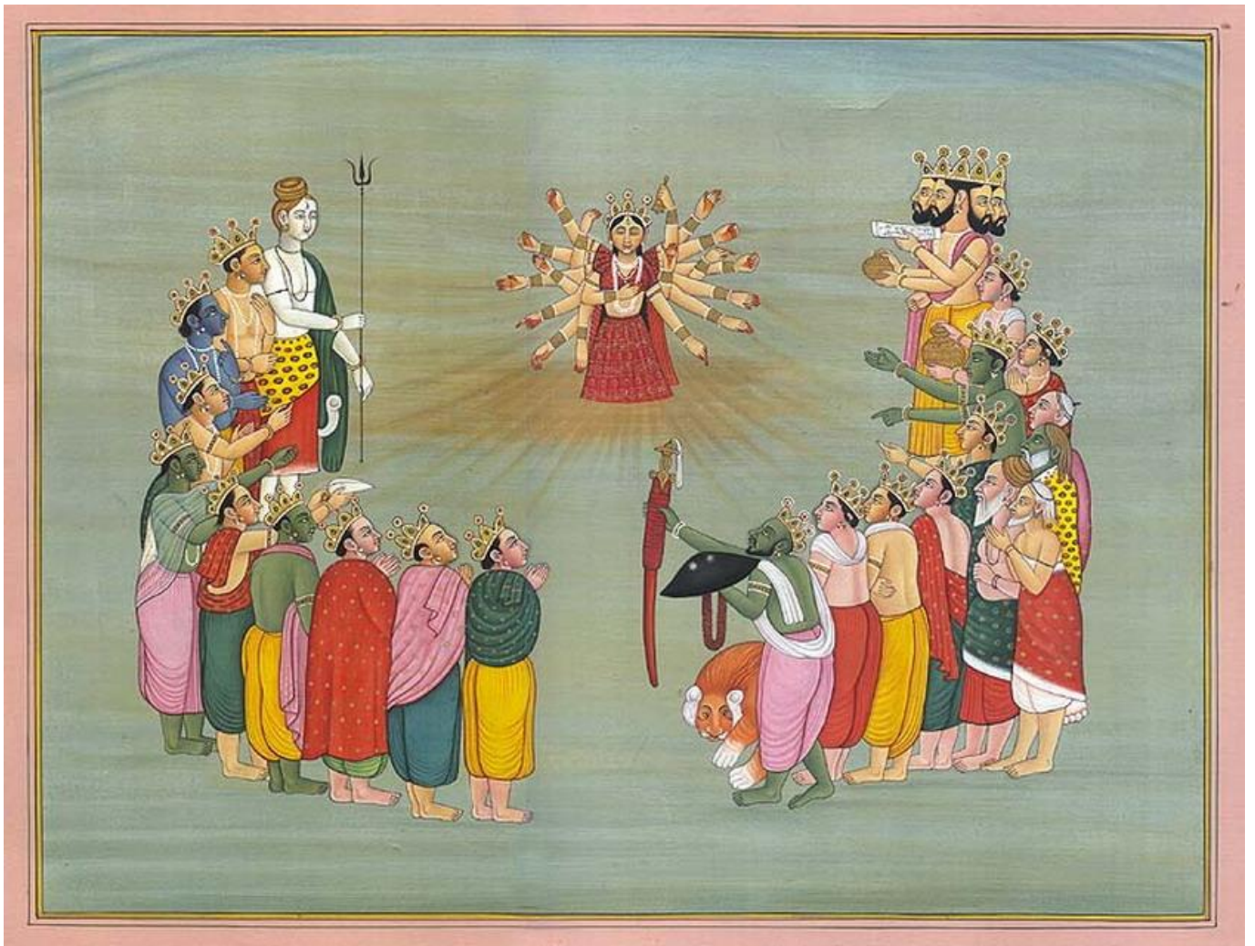
Devi dirigeant le Conseil des Dieux...