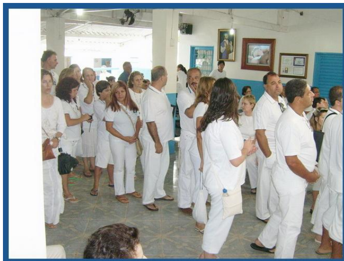
La file d'attente se forme...

Comme il est de bonne heure, histoire de m'y préparer, j'en profite pour faire un bain de cristal de 20 minutes. Totalement détendu, je retourne ensuite à la Pousada pour le repas de midi. Mais pendant le repas, la question se pose en moi de savoir si je dois me contenter d'une opération invisible comme 98 % des gens ou alors si je dois demander une seconde opération visible par Joao alors que ma requête est totalement spirituelle... Dilemme.