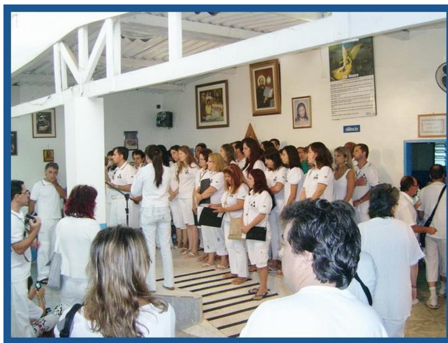
Le groupe des Médioms de Petrópolis animant la prière...