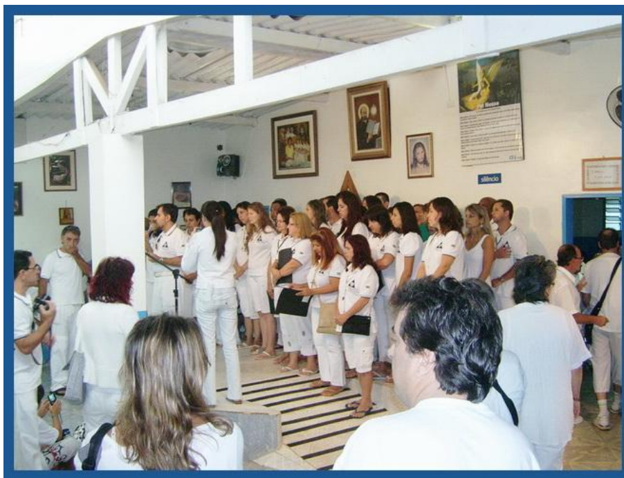
Le groupe des Médioms de Petrópolis animant la prière...