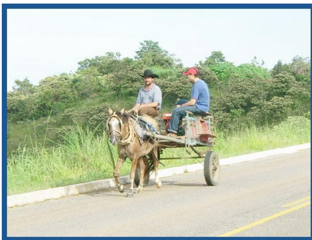
Au Brésil, tout se côtoie avec une très belle Harmonie...